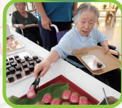
「お、これも食べちゃ!!」