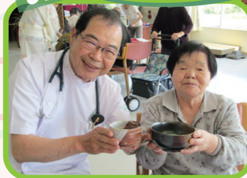
「いーぐ撮ってけろよー!!」