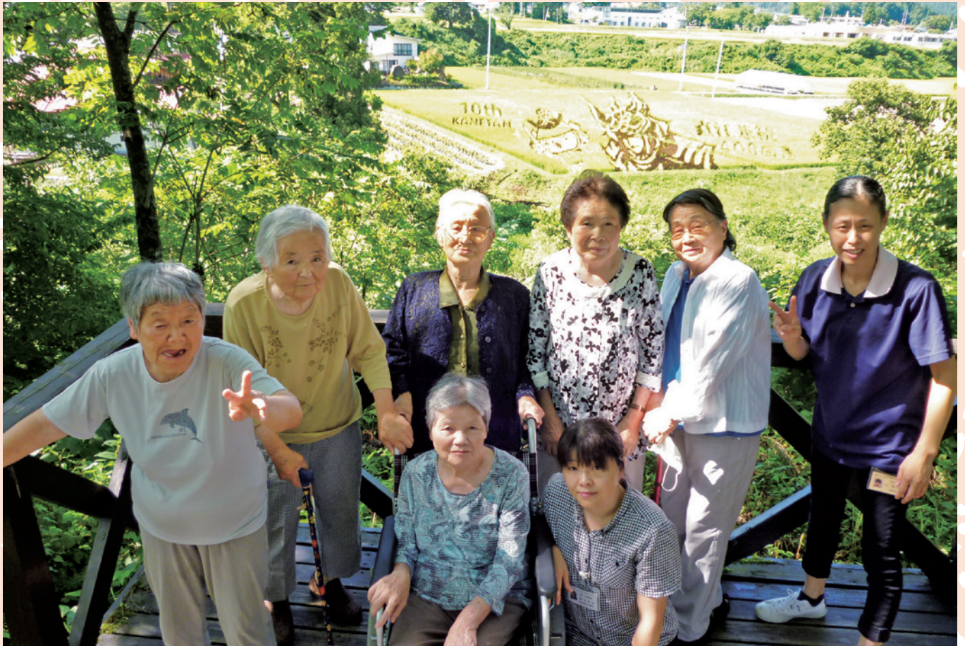
デイサービスセンターさんデイケア たんぽアートにて