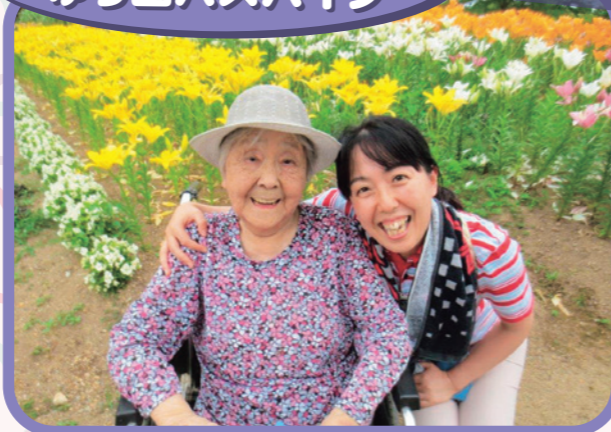
満開の百合と... ほんに、きれいだなあ