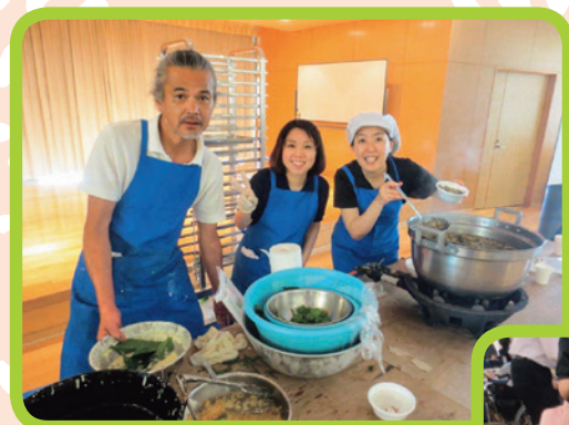
特養・老健サンファミリア米沢 「山菜振舞い」