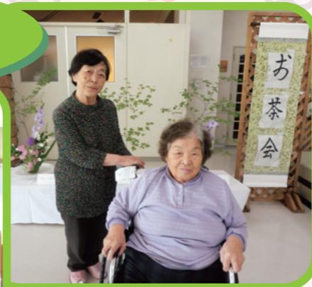
生け花の前で記念の一枚