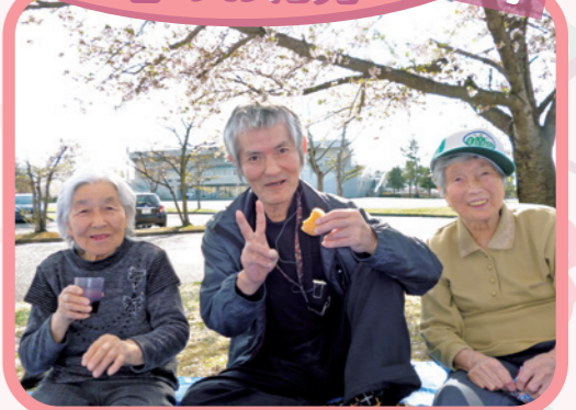
きれいな桜と変わらぬ笑顔! 「きてえがった〜!!」