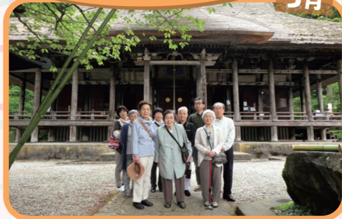
新緑に囲まれた落慶400年の本堂を背に...