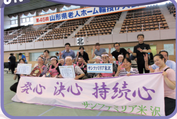
最高のチームワーク! 堂々の3位入賞でした!!