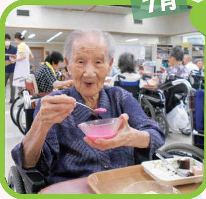
「冷たくてうんめーぞお」