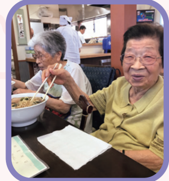
みんなで「ラーメン」一味違う!!